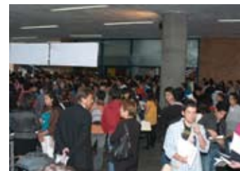
Alumnos de nuevo ingreso