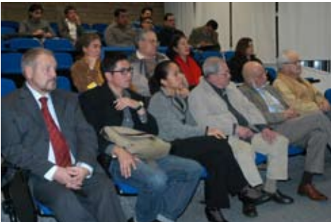
XIV Encuentro La restauración en México y en Italia

Se recibieron en nuestra Facultad 8 visitas de profesores procedentes de la Universitat Politècnica de Catalunya, 2 del Bauhaus Kolleg Dessau y 2 en el marco del XIV Encuentro “La Restauración en México y en Italia” entre l’Università “Gabriele d’Annunzio” di Chieti-Pescara, Italia y el Área del Campo de Conocimiento en Restauración de Monumentos del Programa de Maestría y Doctorado en Arquitectura con la participación de sus profesores y alumnos.