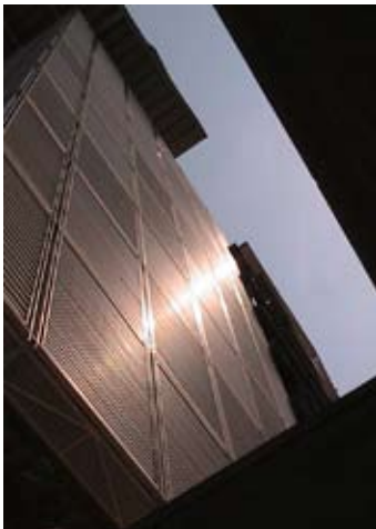
Dirección Arquitectónica de la UPA del INCMSZ

COMISIÓN NACIONAL BANCARIA Y DE VALORES (CNBV) Dirección arquitectónica del proyecto de adecuación de oficinas de la CNBV