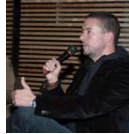
4to Congreso Internacional Arquitectura con Alta Tecnología Bioclimática y Diseño Sustentable

Las actividades de educación continua han derramado sus beneficios en la comunidad al ofrecer como parte de los cursos, conferencias magistrales abiertas a la asistencia de todos los profesores y alumnos interesados. En este periodo se impartieron 21 conferencias de entrada libre; con 1619 asistentes.