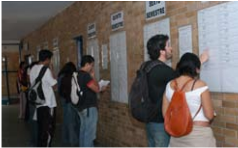
Revisión de horarios