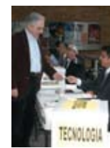
Elecciones de representantes de consejo técnico