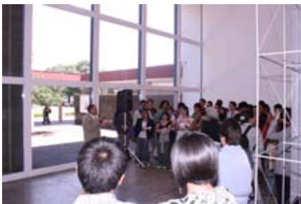
Alumnos de intercambio

La participación de nuestros alumnos en programas de intercambio ha sido una de nuestras prioridades y hemos logrado buenos resultados en cuanto al crecimiento de dicha participación, así, en el semestre 2009-2 participaron 10 estudiantes de la Facultad en Intercambio Nacional y 77 en estudios en el extranjero y en el 2010-1 participaron 3 estudiantes en intercambio nacional y 76 en el extranjero. Para 2010-2 tuvimos un crecimiento de más del 50%, en este período 121 alumnos se fueron de intercambio,