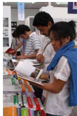
Séptima Arquiferia del Libro