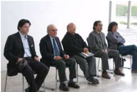
Nuevos Coordinadores de área: