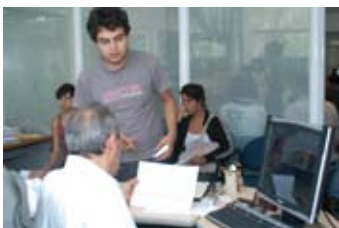
Secretaría de asuntos escolares