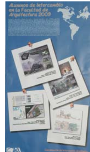
Muestra de trabajos de intercambio académico