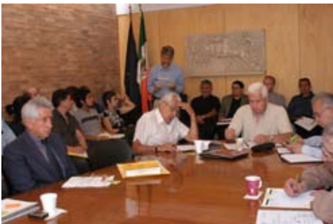
Reunión del H. Consejo Técnico

• Orientación educativa mediante la promoción, realización y apoyo de actividades de formación integral y diferenciada a los alumnos.