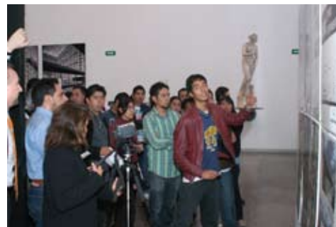
Actividades de formación integral

En el periodo escolar 2009-2, de los 6,663 alumnos reinscritos, 913 lo hicieron a través del Laboratorio de Fundación UNAM y 5,750 lo hicieron en otro sitio, mientras que en el periodo 2010-1 fueron 7,527 alumnos inscritos, de los cuales 498 se inscribieron a través del Laboratorio y los 7,029 restantes en otro sitio.