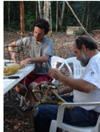
Taller de Diseño industrial, Mayan Design