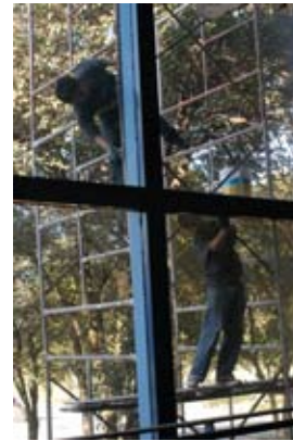
Mantenimiento y limpieza de las instalaciones de la Facultad de Arquitectura

Se realizaron trabajos para el equipamiento multimedia de las aulas 6 y 7 para los programas de Educación Continua.