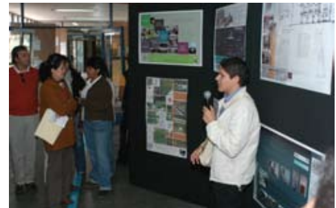
Premio a la Excelencia al Servicio Social y Práctica Profesional Supervisada