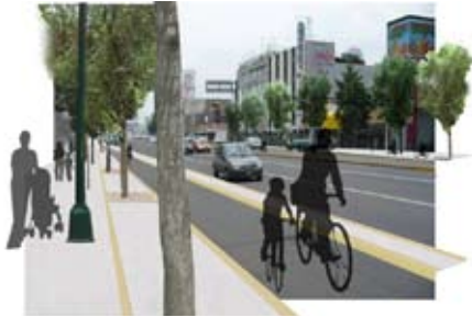
Estrategia en movilidad no motorizada, proyectos de cicloestacionamientos y ciclovias en la Ciudad de México