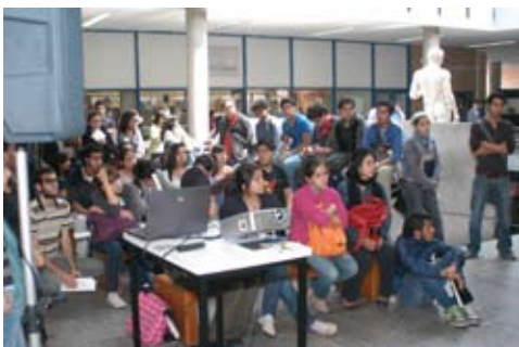
Exposicion del barrio a la metropoli

Se iniciaron los trabajos de los convenios de colaboración con la Universidad de Lanús, Buenos Aires y Universidad Centro Americana de Nicaragua. En este sentido, la Licenciatura en Urbanismo, junto