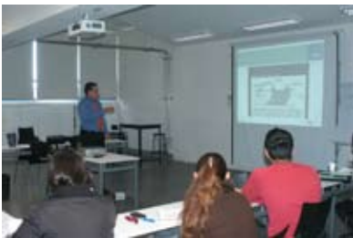
Cursos de actualización docente