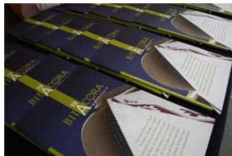
Bitácora no. 19