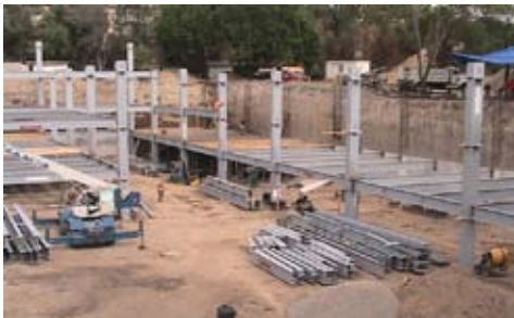
Dirección Arquitectónica del Instituto de diagnóstico y referencia epidemiológica

SECRETARIA DE DESARROLLO URBANO Y VIVIENDA (SEDUVI) Componentes de investigación para el programa general de Desarrollo Urbano del DF: captura de plusvalías, construcción de la vivienda, nuevos instrumentos y mecanismos de gestión.