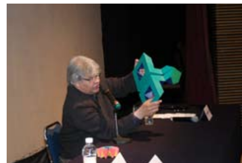
Conferencia Sebastián en el Teatro Carlos Lazo