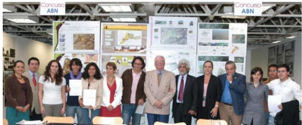
Premiación Concurso Ángel Borja Navarrete

Este año la temática del concurso "Vivienda sustentable en la periferia de las ciudades", proponía realizar un proyecto que contemplara la posibilidad de dar una nueva solución a los conjuntos de vivienda en el