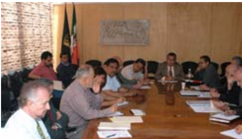
Revisión de Plan de estudios de la Carrera de Arquitectura

En lo que respecta a la Licenciatura en Arquitectura, tras un proceso cuidadoso y abierto a la participación de toda la comunidad de la Facultad, a finales de 2008 se concluyó la etapa de diagnóstico del Plan de Estudios; el cual fue aprobado por el H. Consejo Técnico y el Consejo Académico del Área de las Humanidades y las Artes. A principios de 2009 el Colegio Académico inició la segunda etapa para la modificación del Plan de estudios de la Licenciatura en Arquitectura recibiendo permanentemente el apoyo de la Dirección General de Evaluación Educativa a través de su Coordinación Académica.