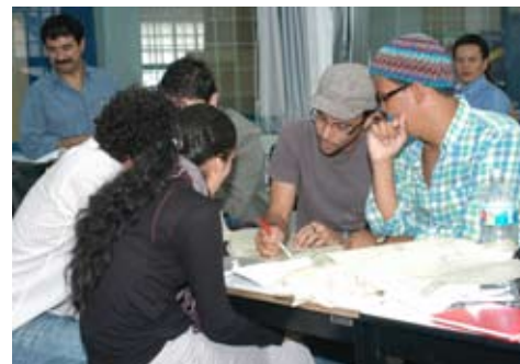
Alumnos visitantes nacionales

El intercambio académico de profesores también es una prioridad para nosotros y lo hemos seguido impulsando para lograr que nuestros