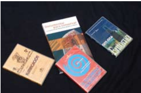
Publicaciones de la Facultad de Arquitectura