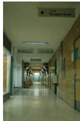
Instalaciones del CIDI

Se colocó un nuevo Directorio en el vestíbulo principal del edificio del Posgrado, para una mejor señalización y claridad de las áreas que en él se encuentran.