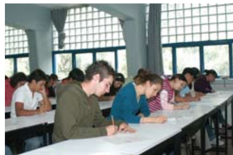
Exámenes de conocimientos generales