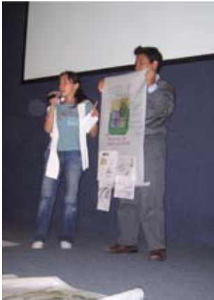
Viaje de prácticas