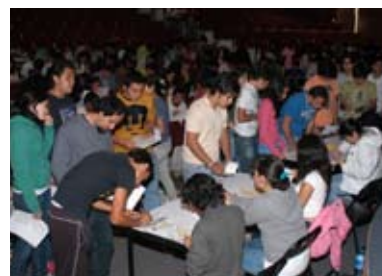
Jornada Médica de Bienvenida