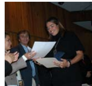
Entrega de reconocimientos a los más altos promedios