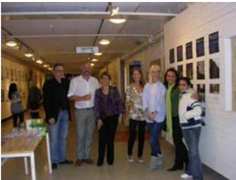
Seminario Taller UNAM-NTNU

en enero de 2009 tuvo su segunda edición, en él participaron más de 220 proyectos de alumnos de distintas universidades.