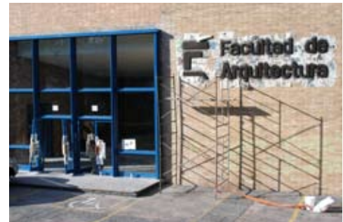
Mantenimiento de la Fachada