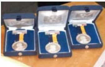
Medalla de plata Alfonso Caso

para consejeros técnicos alumnos en cuatro talleres; asimismo se conformaron las comisiones dictaminadoras de las licenciaturas en: Arquitectura; Urbanismo y Arquitectura de Paisaje.