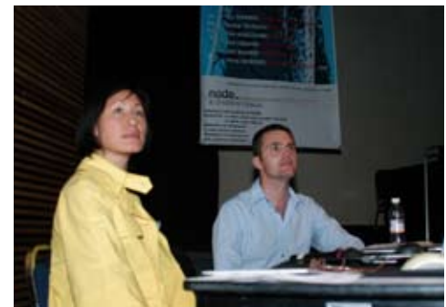
4o Simposium de Arquitectura Progresiva