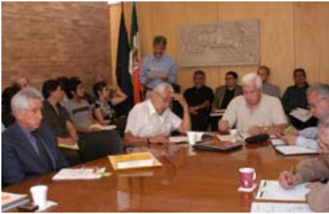
Elecciones extraordinarias para consejeros técnicos