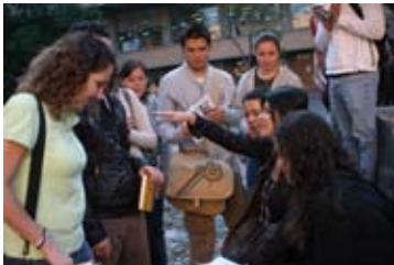
Alumnos de intercambio