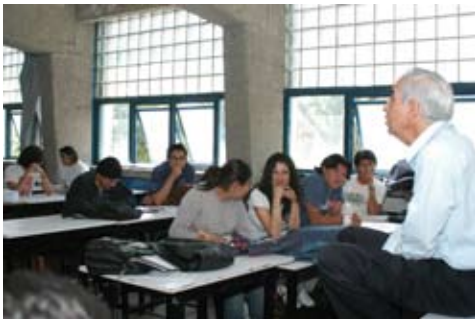
Clase Facultad de Arquitectura