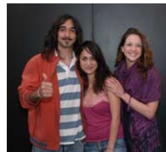
Ganadores Concurso Intertalleres