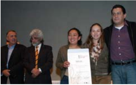
ganadores del proyecto "Rescate Integral de la Cuenca del Río Magdalena Contreras"

de "Rescate Integral de la Cuenca del Río Magdalena Contreras", y mención con el proyecto "Bosque de Aragón" ambos presentado por la Coordinación de Vinculación y Proyectos Especiales de la Facultad de Arquitectura de la UNAM.