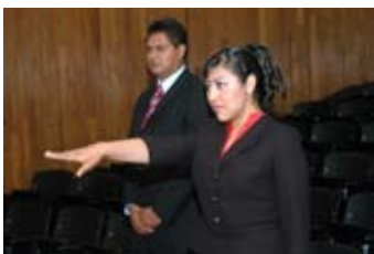
Examen de titulación