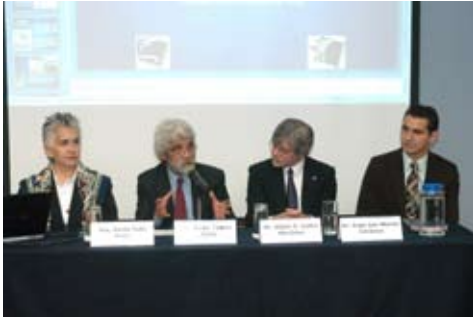
Investigadores del CIEP