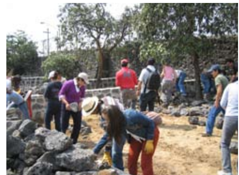
Brigadas para Apoyo Comunitario