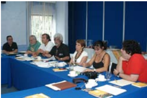
Reunión del Director con su equipo de trabajo

La Planeación debe favorecer la participación de la comunidad, en un proceso permanente, orientado a satisfacer las condiciones para el óptimo desempeño de las funciones sustantivas de la Institución. Es en este sentido que se hizo una reestructuración reemplazando las coordinaciones de Planeación y la de Apoyo a la docencia por dos nuevas coordinaciones que son Coordinación de Planeación y Desarrollo Institucional y Coordinación de Apoyo Estudiantil.