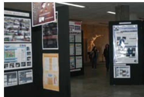
Exposicion del Barrio a la Metrópoli