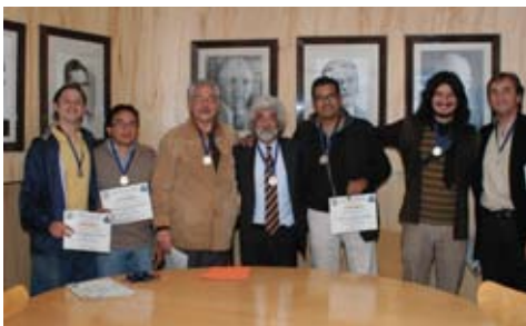
Académicos ganadores de baloncesto