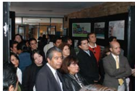
Muestra de trabajos de Servicio Social

Dentro de estos programas, podemos resaltar los que llevan continuidad y han sido más exitosos dentro de la comunidad como: "La UNAM en tu comunidad"; el proyecto para el desarrollo integral para "chavos en situación de calle"; unidades habitacionales de interés social del Distrito Federal Ollin Callan y los programas de mejoramiento de barrio y vivienda en las delegaciones de Iztapalapa, Tlalpan y Coyoacán.