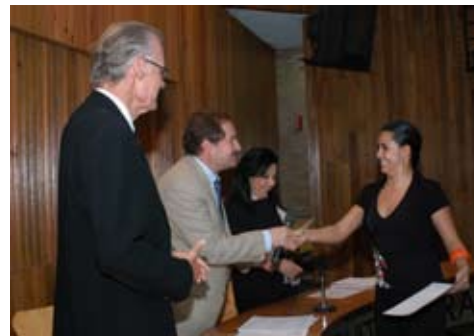
Diplomado en Arquitectura interior

Con la finalidad de establecer nexos con instituciones y organizaciones profesionales se establecieron convenios de colaboración que han permitido ofrecer otros cursos y diplomados, como el convenio con el Instituto de Vivienda del Distrito Federal, INVI, con el cual se impartieron los diplomados de Desarrollo del proyecto ejecutivo y el de Supervisión y Control de obra con 19 y 21 participantes respectivamente.