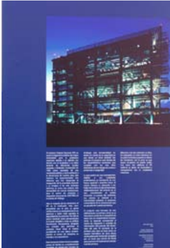
Centro de Cómputo y resguardo documental del IFE

En lo que respecta a la necesidad de estrechar los vínculos con los sectores sociales, hemos dado continuidad al trabajo a través de las diferentes coordinaciones para tener una presencia cada vez más destacada y cumplir así con los objetivos de la Universidad, convirtiéndonos en una Facultad propositiva capaz de impulsar el cambio, atendiendo a los problemas reales y contribuyendo con sus propuestas al desarrollo nacional.