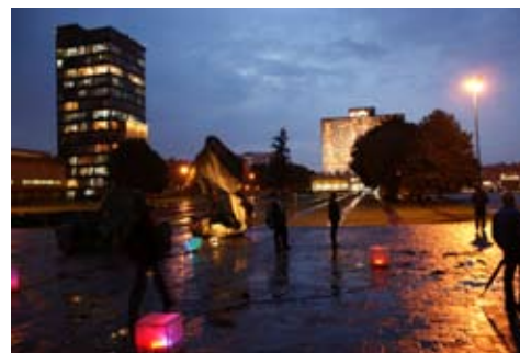
Diplomado en diseño de iluminación arquitectónica