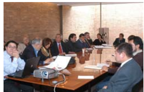
Revisión para la modificación del Plan de estudios de la Carrera de Arquitectura

De igual manera con la participación de la comunidad se encuentran en revisión los planes de estudio de la licenciatura de Arquitectura de Paisaje y Diseño Industrial. La Licenciatura en Arquitectura de Paisaje