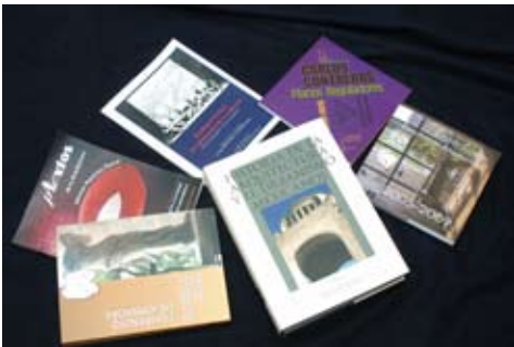
Publicaciones de la Facultad de Arquitectura