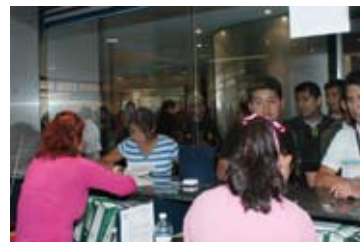
Oficina de Servicios Escolares