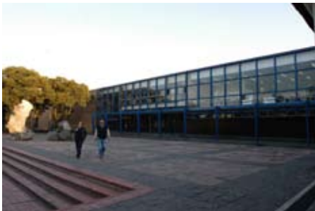
Fachada vista al Campus

Es importante mencionar el incremento en la generación de ingresos extraordinarios, mediante la ampliación de la capacidad instalada en la Coordinación de Vinculación, ya que durante el período que se informa se llevó a cabo la firma de 22 proyectos; pues sin duda ésta es una excelente fuente de ingresos para mantener y mejorar las instalaciones físicas de la Facultad.