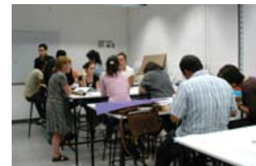
Ampliación de espacios en la Lic. de Arq. de Paisaje