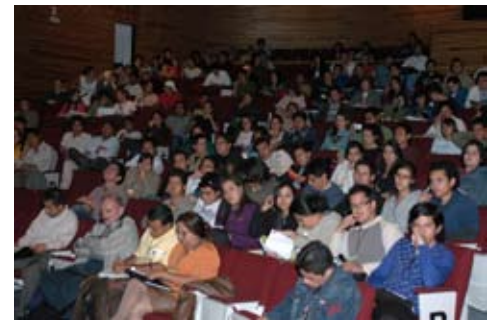
4to Congreso Internacional Arquitectura con Alta Tecnología Bioclimática y Diseño Sustentable