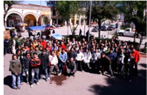
XXVI Congreso Nacional de Servicio Social

De diversas maneras procuramos ir construyendo una cultura cada vez más sólida de protección al medio ambiente, entre otras actividades podemos destacar: