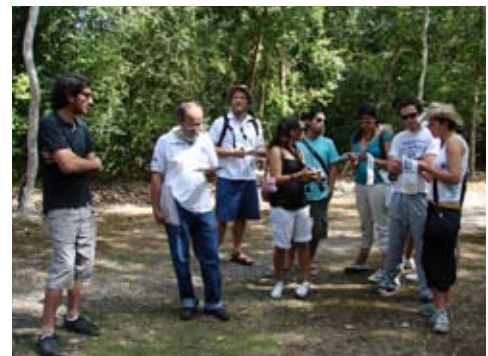
Taller de Diseño industrial, Mayan Design