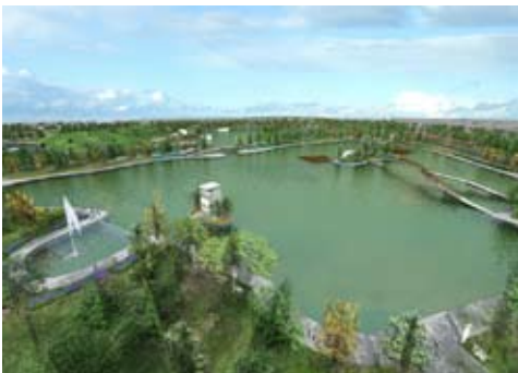
Plan maestro y Proyectos ejecutivos del Bosque de San Juan de Aragón

Estrategia en movilidad no motorizada, proyectos de ciclo estacionamientos y ciclovías en la Ciudad de México