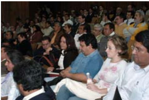
Cursos Educación Continua

Dando continuidad a los trabajos para reorganizar los distintos espacios de la Facultad y optimizar su aprovechamiento se acondicionaron las oficinas de Servicios Escolares para compartir su espacio con la Coordinación de Exámenes Profesionales concentrando además, áreas