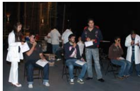
Jornada Médica de Bienvenida

En este mismo sentido, se llevó a cabo la planeación y programación del Examen Médico de Egreso para 507 alumnos de 8° semestre de las cuatro licenciaturas que se imparten en la Facultad, y para este proceso se atendió a 286 estudiantes que presentaron alta vulnerabilidad. Dentro de la Jornada Médica de Bienvenida se atendió a 1200 estudiantes de primer ingreso.