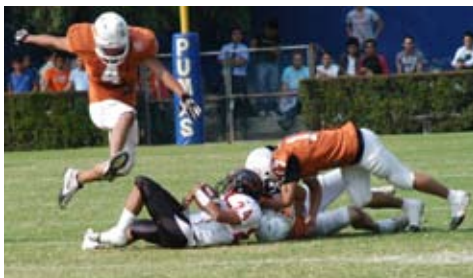
Tazón de la mezcla 2009

Con el objeto de conformar y actualizar el padrón de egresados, la Coordinación de Exámenes profesionales, continúa con la captura de datos de los alumnos que realizan su trámite de titulación; a fecha se tienen alrededor de 1725 registros aproximadamente.