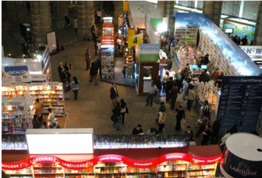
XXXI Feria Internacional del Libro del Palacio de Minería