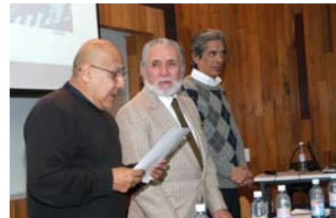
Examen de titulación