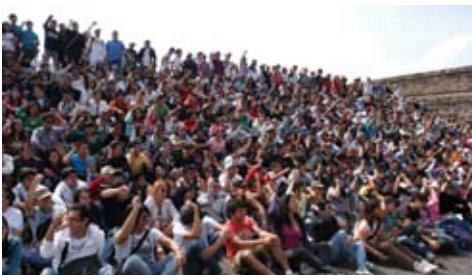
Actividades de Bienvenida