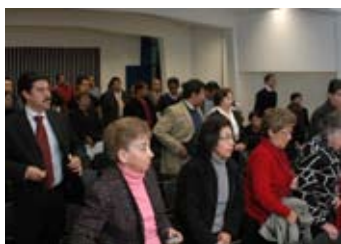
Examen de titulación