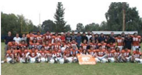
Tazón de la mezcla 2009

En fútbol americano se ganaron tres encuentros en el que destaca mencionar El Tazón de la Mezcla, 2009. En fútbol soccer varonil logramos pasar a cuartos de final en el pasado ínter facultades. En fútbol rápido femenino tuvimos una buena participación pasando a octavos de final. En baloncesto se participó satisfactoriamente en ambas ramas, en la rama femenino se llegó a cuartos de final; en la rama Varonil el equipo de la Facultad llegó a la final quedando subcampeón del torneo Inter Facultades.