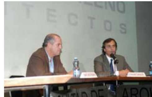
Conferencia del Arq. Sordo Madaleno

Con el objeto de difundir lo que somos hemos participado en programas de radio, tv y a través de la prensa escrita en diferentes ocasiones como la participación en el programa "11 en las mañanas", el tema fue "Saturando la mirada, contaminación visual", así como la participación en el periódico Universal con el tema "Ciudades sin pavimentos" y con la Dirección General de Televisión Educativa (DGTVE).