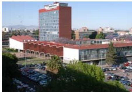
Posgrado de la Facultad de Arquitectura

El mayor recurso con que contamos es el humano, nuestra facultad tiene la posibilidad de ofrecer servicios educativos de la más alta calidad, por lo que la Coordinación de educación continua ofrece cursos y diplomados que permiten captar recursos y fortalecer nuestras funciones sustantivas.