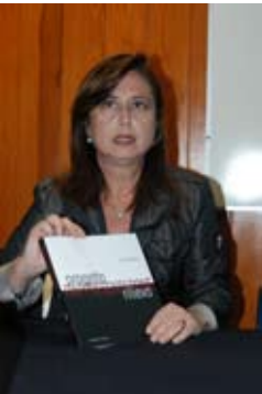
Presentación del libro “Progetto Rappresentazione Rilievo”