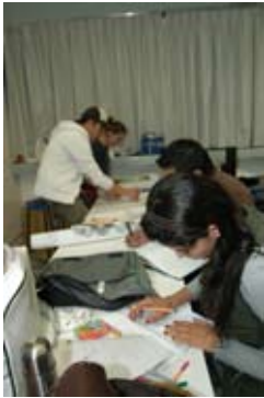
Alumnos de intercambio