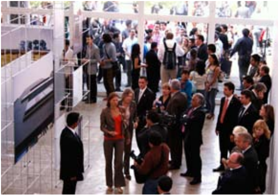
Seminario Taller UNAM-NTNU

Así mismo, se iniciaron acercamientos con la Norwegian University of Science and Technology de Trondheim, Noruega, y 5 profesores de esta universidad impartieron conferencias en marzo, en el marco del Seminario taller UNAM- NTNU “Las tradiciones tectónicas de México y Noruega y su enseñanza”, posteriormente 2 profesoras fueron invitadas a impartir un Taller en dicha universidad y a dar 2 conferencias; en este momento se están haciendo las gestiones para firmar un convenio de colaboración.