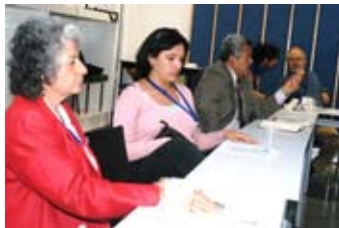
Mesa de profesores, Reunión ASINEA