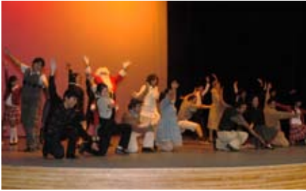
Obra de Teatro