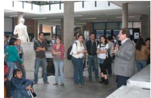
Exposicion del barrio a la metrópoli

Como lo hemos hecho desde 2005, hemos seguido trabajando para mejorar nuestros índices de titulación, nos hemos apoyado en las opciones aprobadas por Consejo Técnico en las cuatro licenciaturas y así hemos puesto en marcha 9 de las 10 opciones aprobadas. En este 2009, la opción de seminario de tesis o tesina sigue ocupando el primer lugar de alumnos titulados, con 268 alumnos que representan el 60 %.