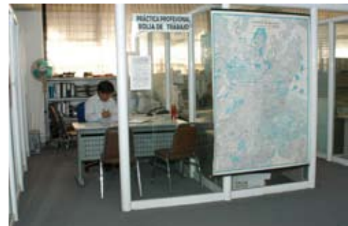
Atención y asesoría de Servicio Social