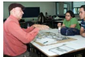
Aula de clases