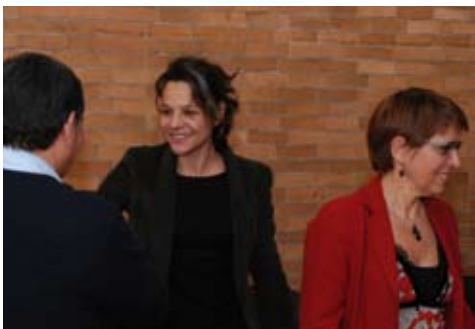
Entrega de diplomas

los 2 cursos del Programa de actualización docente para profesores de bachillerato (PASD-DGAPA), el 12° Diplomado en Formación Docente, (DGAPA), 6 cursos de actualización docente para profesores de licenciatura organizados por la Facultad, y en dos curso de Formación Docente organizados por la DGOSE.