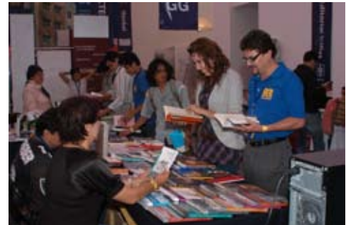
Arquiferia del libro