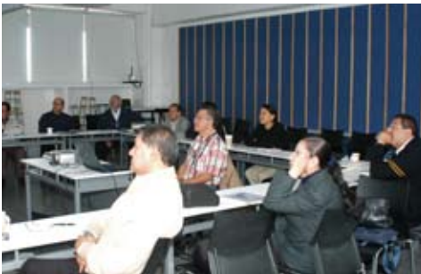
Programa de actualización docente

Este programa se ha difundido a través del boletín Repentina de la Facultad, llevando un registro que nos permite mantener comunicación permanente con los alumnos para poder brindarles el apoyo necesario para su reintegración.