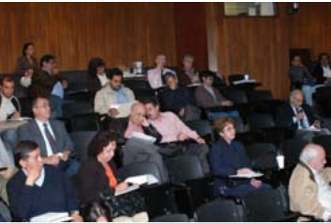
Revisión del Plan de estudios de la Carrera de Arquitectura

La actualización y mejora de los planes de estudio es una tarea prioritaria para mejorar la calidad académica, nos hemos ocupado de ello desde el inicio de esta administración, formamos parte del Comité académico de carrera instancia colegiada creada por el Consejo académico del área de las Humanidades y de las Artes que tiene como objetivo fortalecer el desarrollo de las licenciaturas; como parte de las actividades del Comité participamos en el curso-taller: “Orientaciones para la elaboración y/o evaluación de proyectos de adecuación de planes y programas de estudio” , realizado en octubre de 2009.