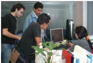
Alumnos de intercambio