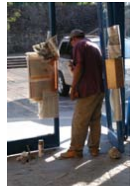
Trabajo de pintura