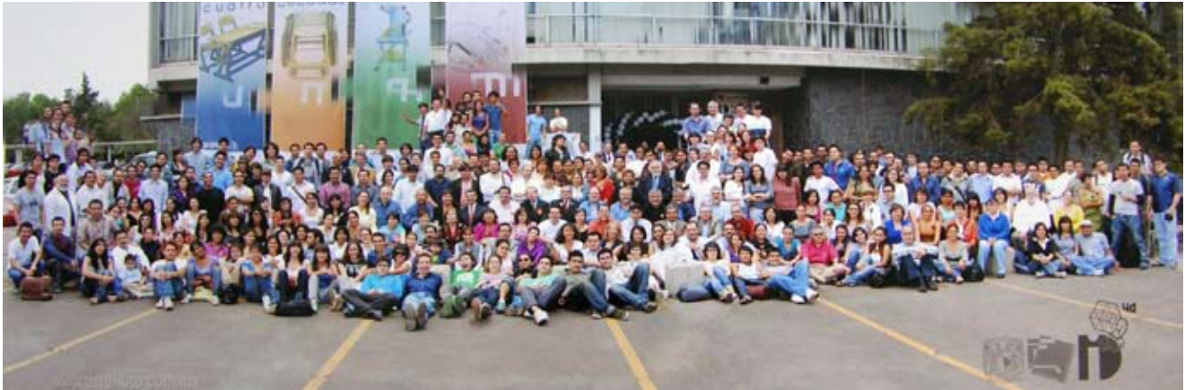
Aniversario de el CIDI