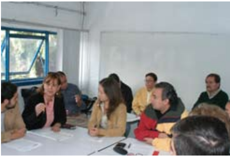
Revisión del Plan de estudios de la Licenciatura en Arq. de Paisaje

Programas de Diseño, A.C., (COMAPROD). Dichos organismos hacen un seguimiento anual de los programas con el objetivo de verificar avances, uno de ellos, el de la Licenciatura en Diseño Industrial se encuentra actualmente en el proceso de Re-acreditación; los otros tres cumplieron en tiempo y forma con el Informe Anual de avance sobre las Sugerencias, Observaciones y Recomendaciones que el COMAEA les hiciera en el momento que fueron acreditados.