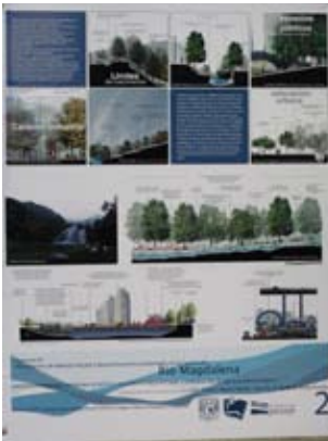
proyecto ganador de la primera biend de arquitectura de paisaje