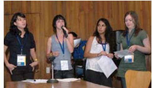
Mesa de alumnos, Reunión ASINEA

Del 26 al 31 de Octubre asistimos a la XXIII Conferencia Latinoamericana de Escuelas y Facultades de Arquitectura (CLEFA) celebrada en la Facultad de arquitectura, diseño, arte y urbanismo de la Universidad de Morón en Buenos Aires Argentina en donde el tema central fue: “Sustentabilidad y Medio Ambiente”.