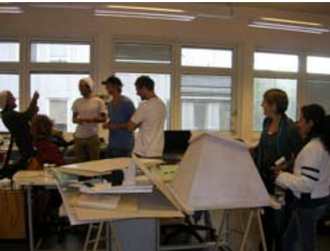
Seminario Taller UNAM-NTNU