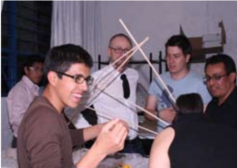
Seminario Taller UNAM-NTNU