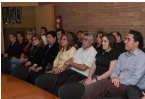
Profesores que acreditaron el 12° Diplomado de Formación Docente