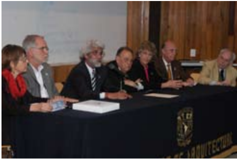
Premio Carlos Lazo, en el servicio público: