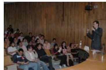
Actividades de educación continua