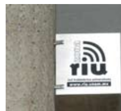
Red Inalámbrica Universitaria RIU