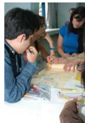
Alumnos visitantes internacionales