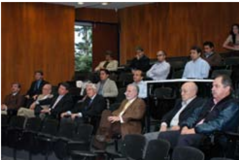
Curso de actualización para peritos valuadores