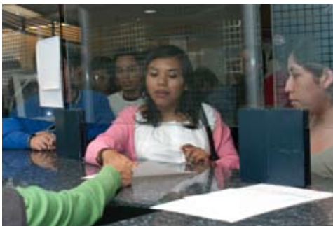
Oficina de Servicios escolares

El segundo lugar lo ocupa la opción por reporte de trabajo profesional , instrumentada para promover la titulación de aquellos alumnos que estén cursando el seminario de titulación II y de los egresados con el 100% de créditos y - en ambos casos - se encuentren laborando dentro del campo profesional, la cual tiene como requisito presentar un reporte profesional como documento final. En esta opción tuvimos este año 73 titulados que representa más del 16 % de nuestros titulados.