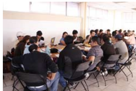
Viajes de práctica de Servicio Social