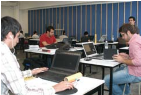
Premio a la composición arquitectónica Alberto J. Pani

Así que en 1985 se retoma la idea del concurso, el cual se ha celebrado de manera ininterrumpida a los largo de 25 años, con el objeto de reunir a los estudiantes de arquitectura seleccionados por las instituciones afiliadas a la Asociación de Instituciones de Enseñanza de la Arquitectura de la República Mexicana (ASINEA).