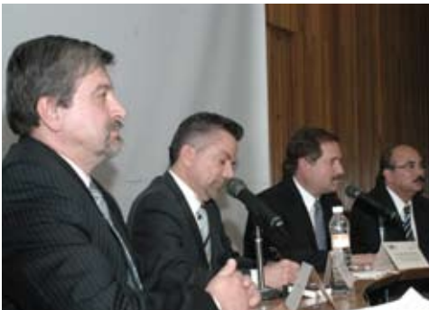
Cursos de Apoyo a la Docencia

La falta de espacios a la que nos enfrentamos cada día debido al aumento de la matrícula nos ha llevado a realizar tareas que permitan programar de la manera más eficiente el uso de las aulas, para ello se elaboró el diagnóstico y las gráficas de uso de aulas y de alumnos inscritos a Taller de Arquitectura por semestre de los periodos escolares pares y se llevó a cabo la proyección de cupos para la programación de las aulas tanto para los cursos obligatorios como para los cursos de Apoyo a la Docencia, de Educación Continua y los cursos extracurriculares de los periodos 2009-2 y 2010-1.