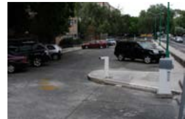
Estacionamiento para personas con discapacidad y Profesores Mayores

Ampliación de espacios académicos en la Licenciatura de Arquitectura de Paisaje. A partir de agosto de 2009 comenzaron las obras para la construcción de una azotea verde a un costado del herbario y se reubicó la bodega de Arquitectura de Paisaje.