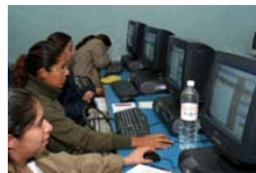
Centro de cómputo Augusto H. Álvarez