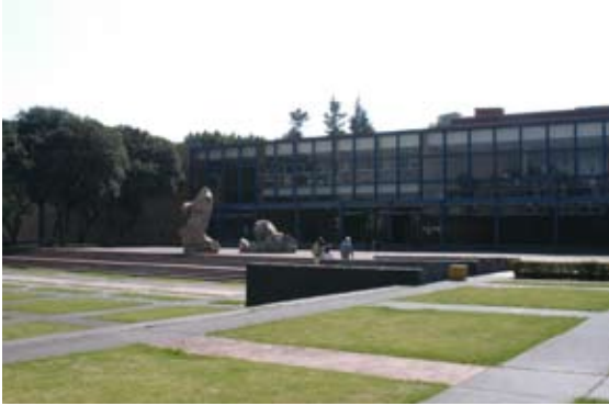
Fachada de la Facultad de Arquitectura

ejercicio 2009, el cual incorpora recursos presupuestales extraordinarios provenientes de entidades externas a la UNAM.