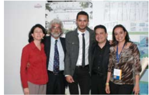
Premio Alberto J.Pani

El 20 de Mayo de 2009 se llevó a cabo la premiación de la 1ª Bial de Arquitectura de Paisaje. En la organización de este evento se contó con la colaboración de la Sociedad de Arquitectos Paisajistas de México (SAPM). En esta ocasión se obtuvo el primer premio en la categoría de proyectos con valor en sustentabilidad con el proyecto