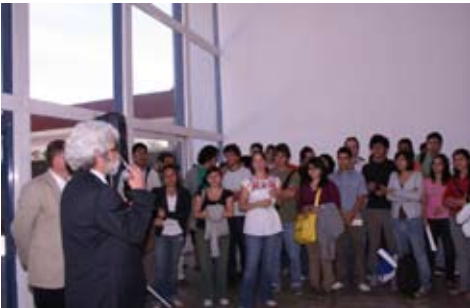
bienvenida a alumnos de intercambio