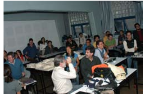
Taller unam NTNU

Se ha dado continuidad al Programa de fortalecimiento de los estudios de licenciatura , programa institucional que da seguimiento del desarrollo escolar de alumnos, generando reportes periódicos de los índices de aprobación por materia y por profesor; así como con la operación del programa de tutorías y la optimización de los servicios escolares, bibliotecarios y la orientación a los estudiantes.