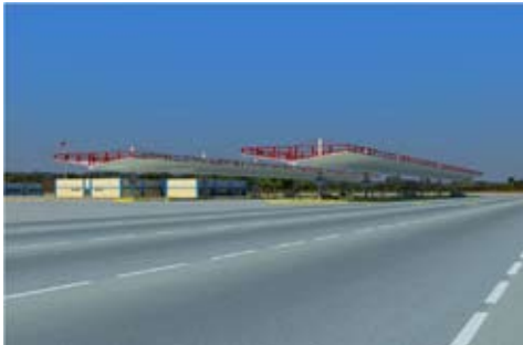
Desarrollo de proyectos de remodelación de instalaciones aduaneras en las fronteras norte y sur.