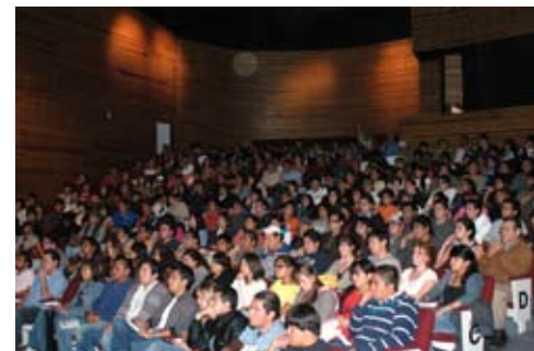
Conferencia en el Teatro Carlos Lazo