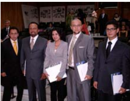
Titulados por opción de Posgrado en la modalidad de cursos de especialización