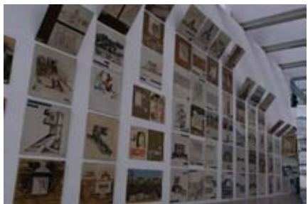
Exposición Arquitectura de México