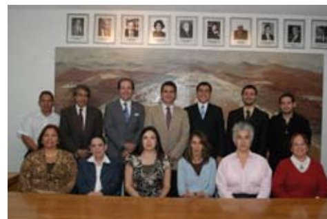
Investigadores del CIEP