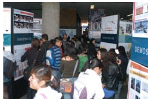
XXIV Muestra estudiantil