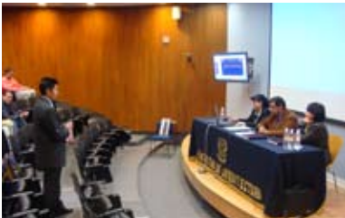
Examen de titulación